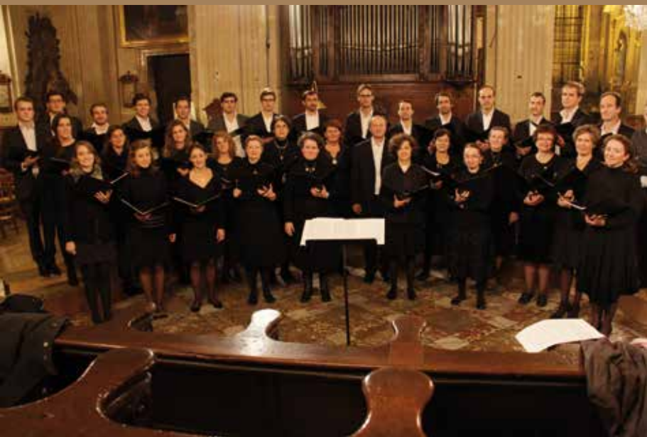
Chœur Fra Angelico - 15 novembre 2014